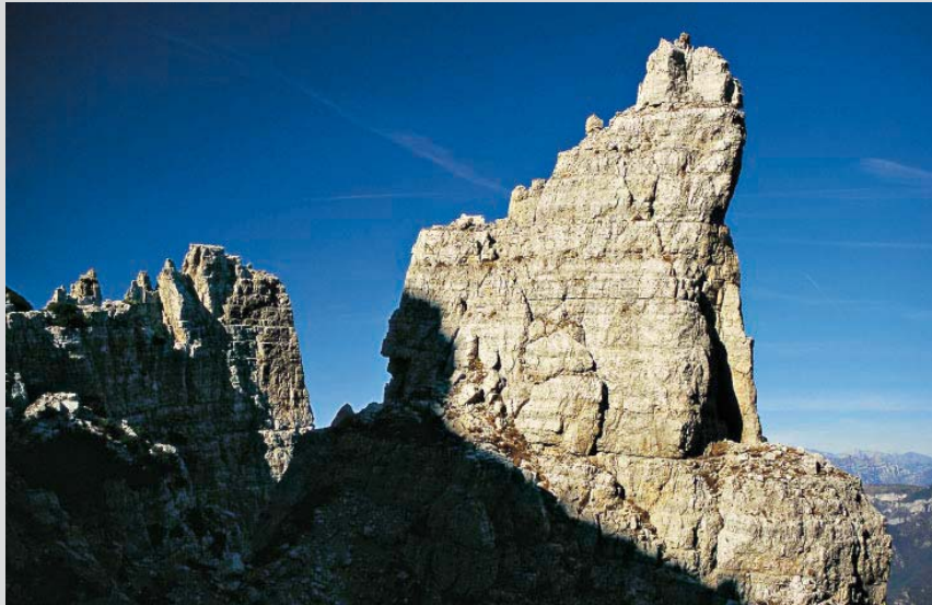
Oben: Spektakuläre Felszacken begleiten den Sentiero del Fumante. Rechts: Auf dem Sentiero del Fumante braucht's einen sicheren Tritt.

Grathöhe knapp rechts der Forcella Lovaraste (1919 m). Südseitig bricht das Gelände in einem wilden Rinnengeflecht ab, nebenan wird ein Zacken von einem Kreuz geziert (mit etwas Kletterei erreichbar). Das spannendste Stück steht uns nun zwischen Forcella Lovaraste und Forcella del Fumante bevor. Der schrofige Pfad wechselt hier im Auf und Ab zwischen den Gratzacken der Guglie del Fumante mehrmals die Seite und gewinnt nach der Forcella del Fumante den Südgrat des Monte Obante. Von dieser Stelle führt Route Nr. 6 abwärts zum Rifugio Scalorbi, während wir am Kamm des Monte Obante weitergehen, den Gipfel knapp links passieren und nach einer an einzelnen Stellen etwas unübersichtlichen Traverse zur wichtigen Bocchetta dei Fondi (2040 m) gelangen. Hier mündet nämlich die Normalroute wieder ein. Vor uns liegt die ostsei-